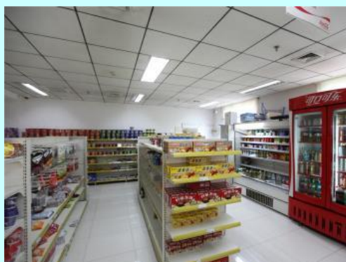
Supermercado da Universidade

Excelentes instalações, dormitórios como hotéis (quarto individual/duplo, TV por cabo, wi-fi, casa de banho com água quente 24 h por dia, roupeiros, cozinha e lavandaria). Biblioteca, salas de aula bem equipadas, cinema, museu de cultura chinesa, piscina, ginásio, centro de fitness e WI-fi em todo o instituto. Assim como buffet, cabeleireiro, massagem, cozinha pública e água purificada.