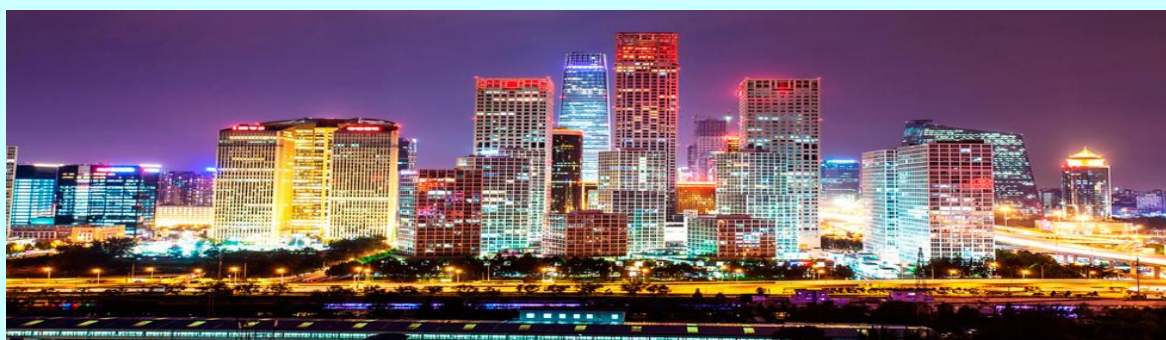
Estádio de Pequim/A Grande muralha na Cidade proibida/Pequim á noite